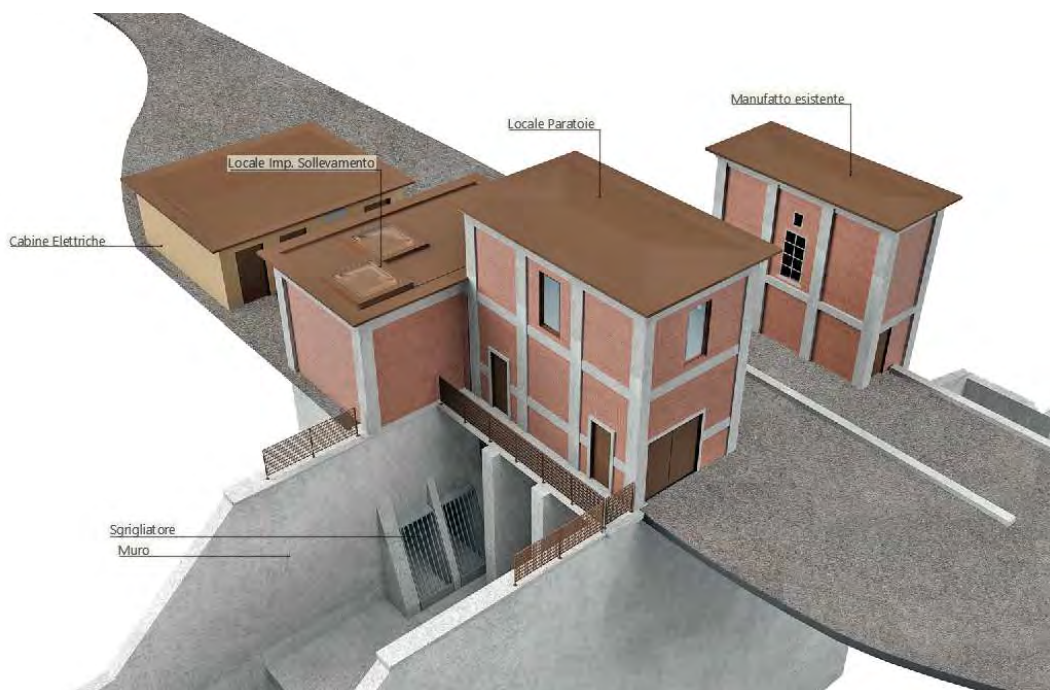
Figura 1: Indicazione delle opere strutturali del complesso principale e manufatti accessori

In dettaglio, considerando, le parti edili ed impiantistiche degli interventi, verranno sviluppate le attività come sotto riportato.